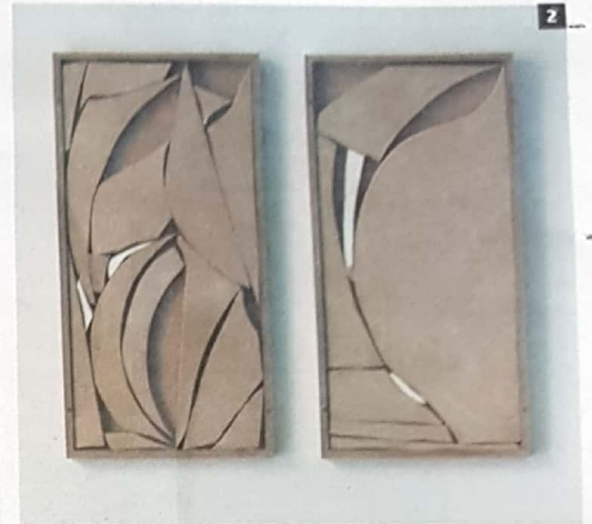
1 S.T. I (Periplo) / S.T. II (Periplo), 2018. Caoba, tablero de fibra de densidad media. 235 x 135 x 10 cm / 235 x 132 x 10 cm. 2 Tangram I. II., 2018. Tablero de fibra de densidad media, metacrilato. 55 x 63 x 2 cm. 3 «La resistencia del ello / Azul como una naranja», 2018. Sala L. Vista general.